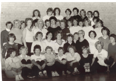
Hausfrauen Montag Abend 1984

Heute halten Sie die neue Info-Aktuell in der Hand. Wir planen, Sie in loser Folge (ca. 4 bis 6 mal im Jahr) mit den Nachrichten über die neuesten Entwicklungen im Verein zu informieren. Es soll eine bunte Mischung aus Information und Unterhaltung werden. Um das möglichst interessant zu machen, benötigen wir Ihre Hilfe. Schicken Sie uns alles, was Sie in der Info-Aktuell lesen wollen. Sie möchten selber mitmachen beim Erstellen der Info-Aktuell? Kein Problem, melden Sie sich beim Vorstand.